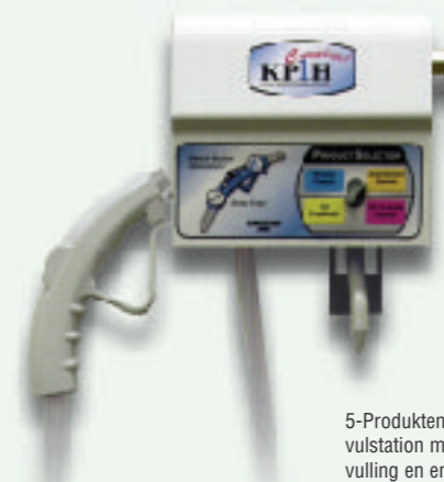
5-Produkten KP1H Complete vulstation met Dial 4 flessenvulling en emmervulling

Het KP1H Complete station kan rechtstreeks uit de doos worden geïnstalleerd. U hoeft alleen maar de dispenser aan de muur te monteren en de chemicaliën- en waterleidingen aan te sluiten. Zo gemakkelijk is het.